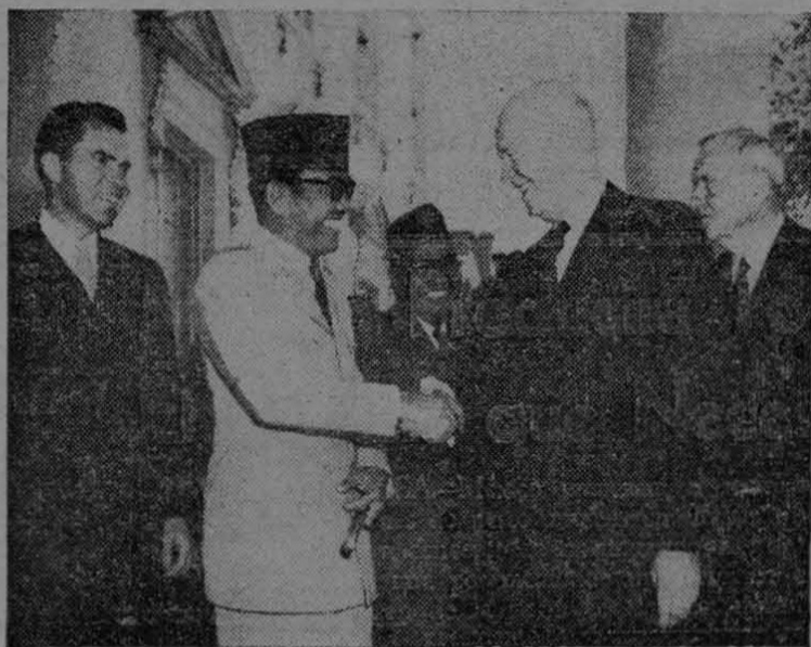
Acompañado del vicepresidente Nixon y el secretario de Estado, John Foster Dulles, el presidente de los Estados Unidos, Dwight D. Eisenhower, da la bienvenida en Washington al presidente Sukarno, de Indonesia, al llegar a los Estados Unidos para hacer una visita oficial de tres semanas.