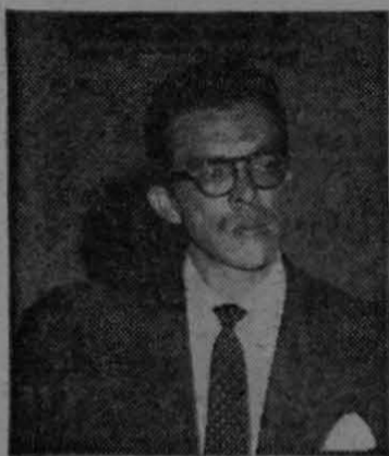
Juan García Esquivel, famoso director de orquesta de México que ha destacado, en recientes conciertos especiales, como el mejor exponente de la música moderna en México.

Y se lanzó a su gran aventura; formó un grupo de nueve elementos que dió sus primeros pasos en XEW. Y la suerte le ayudó en su experiencia... en tres meses sucesos su nombre comenzó a resonar, ayudado por sus "rarezas" musicales, por su audaz concepción de las antiguas normas conservadoras que destruía y transformaba a su arte. Y lentamente