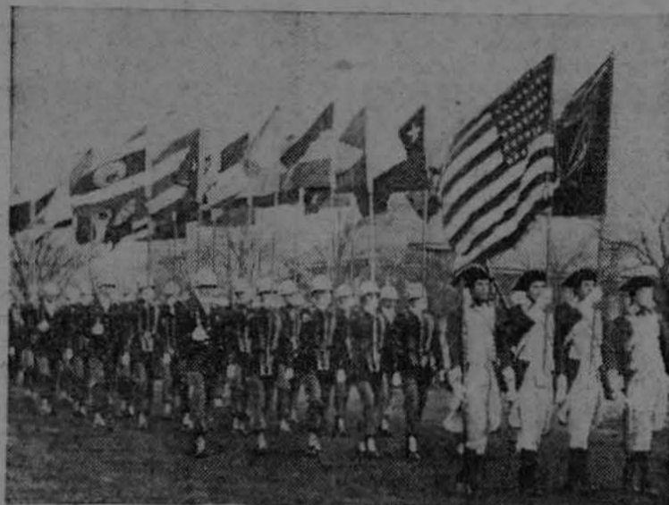
Las banderas de la América Latina ondearon orgullosas en el Fuerte Myer, del Estado de Virginia, al efectuar los miembros del ejército de los Estados Unidos allí estacionados, un desfile en honor de 19 jefes militares latinoamericanos, de visita en el fuerte.